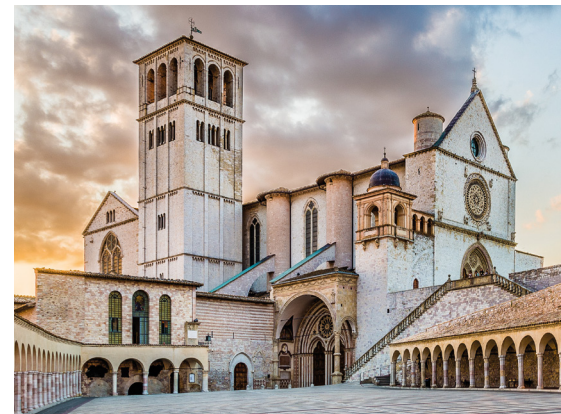
links Kloster Hegne rechts Kloster Münster unten Assisi